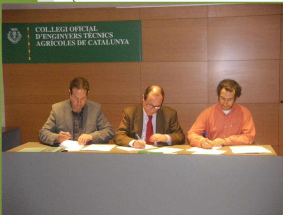
Acte de constitució de la Fundació de la Jardineria i el Paisatge

Us mantindrem informats sobre les novetats i sobre els acords que es prenguin respecte el futur de les NTJ .