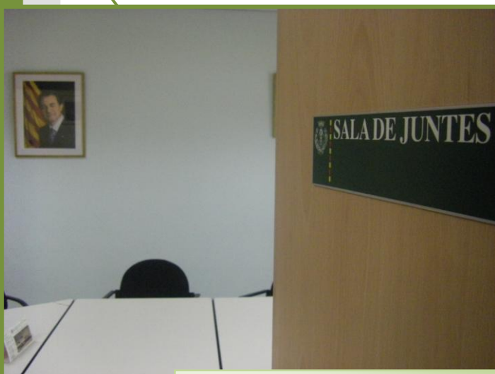
Sala de juntes a la seu del COETAPAC